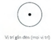
Vị trí gắn đèn (mũi vị trí)