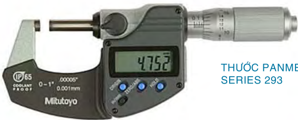
THƯỚC PANME ĐO NGOÀI SERIES 293